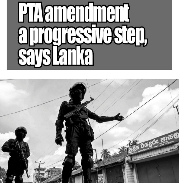
PTA amendment a progressive step, says Lanka

Sri Lanka on Tuesday defended its proposed amendments to the draconian counter-terrorism law as the “most progressive step” towards securing and protecting the fundamental rights of its citizens. The foreign ministry in a statement said the proposed bill to amend the Prevention of Terrorism Act (PTA), which the government intends to introduce in parliament and upon it being passed into law, would be a salutary piece of legislation that would give persons tangible protection. After 43 years since it was enacted, “it would be the most progressive step that would give persons subject to the said law, tangible protection towards securing, advancing and protecting their fundamental rights guaranteed under the Constitution.” The statement comes as Sri Lanka was due to meet the EU sub committee