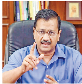
கோவிட்-19 மற்றும் கோவேக்ஸின் தடுப்பூசி மருந்துகளை கொள்முதல் செய்வதற்கான உத்தரவு

அடுத்த ஓரிரு நாள்நிலை, சுமார் 3 லட்சம் கோவிட்-19 தடுப்பூசிகள் பெறப்படும். அதன் பிறகு 18 வயதுக்கு மேற்பட்டவர்களுக்கு தடுப்பூசி போடுவதற்கான நடவடிக்கைகளை தொடங்கும் என்று இணைய வழி பேட்டியின் போது இத்த நிலையில், 67 லட்சம்