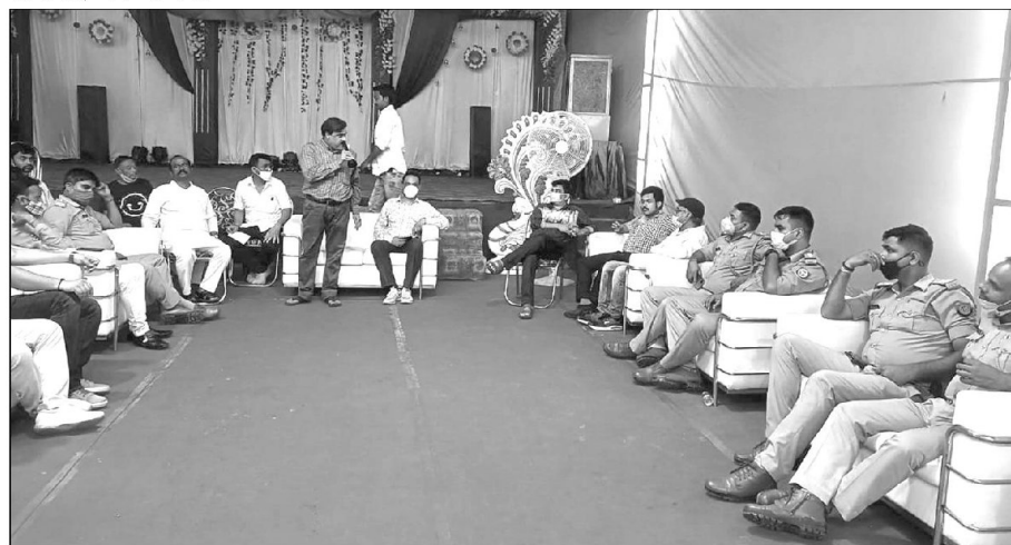
पुलिस अधिकारियों के साथ बैठक करते व्यापारी।