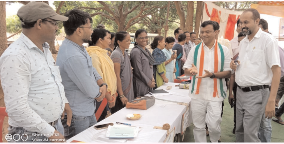
श्रमबिन्दु / तोकापाल