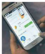
UPI-based payments rose to ₹2.62 trillion in June. MINT

"There are multiple reasons why we have seen such a spurt in digital payments, one of them being that merchants across the country have now opened their doors to digital, and also opening up e-commerce for non-essential goods. Customers have shifted to e-payment for daily necessities and payment of utility,