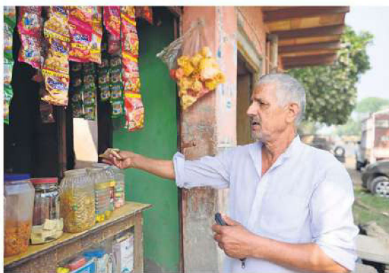
Travel curbs and the closure of schools and colleges have taken a toll on sales in impulse categories. MINT

Prataap Snacks' small packs of 15 and 110 chips sell heavily through small shops and are linked to impulse purchases or