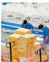
The notice has been issued to the Centre and e-commerce platforms like Amazon, Flipkart. MINT

buy Indian goods to strengthen the nation, it becomes essential that the e-commerce websites conspicuously display the country of manufacturing/origin for all products sold through e-commerce platforms," it said.