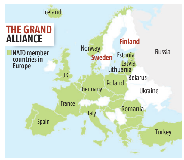
The man does not show an exhaustive list of Furonean members of NATO

the cignatories to "maintain and develop their individual and collective capacity to resist armed attack". Article 5, arguably the most consequential clause, stated that "the Parties agree that an armed them in Europe or America Soviet Union attack.