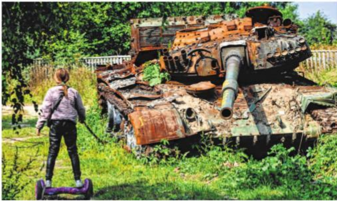
A teenager rides a hoverboard past a destroyed Russian tank in Chernihiv, Ukraine, on Wednesday