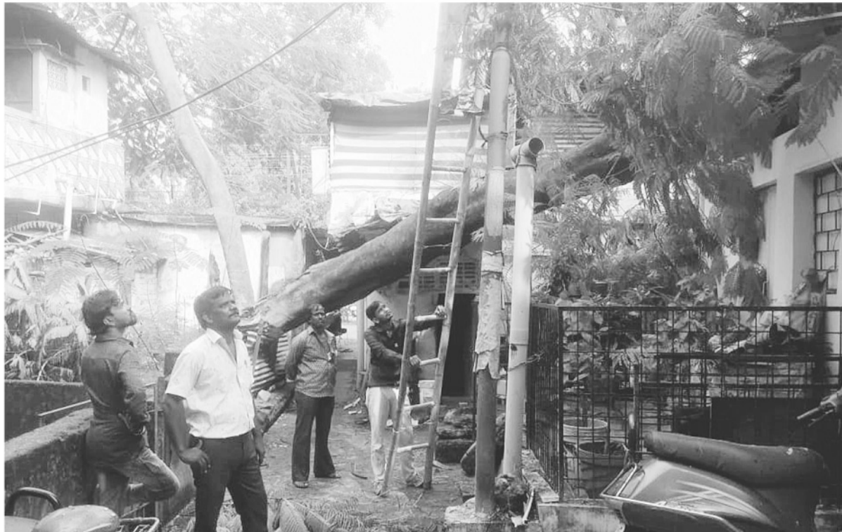
मानसून 2022 - धूप - छांव के बीच तरबतर