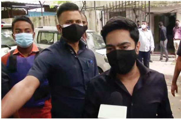
तृणमूल कांग्रेस के सांसद अभिषेक बनर्जी नई दिल्ली में ईडी आफिस जाने से पहले मीडिया से बात करते हुए।

अधिकारियों ने बताया कि मामले के जांच अधिकारी ने धन शोधन निवारण अधिनियम (पीएमएएल) के प्रावधानों के तहत बनर्जी का बयान दर्ज किया। अभिषेक बनर्जी लोकसभा में डायमंड हार्बर सोटा का प्रतिनिधित्व करते हैं और तृणमूल कांग्रेस