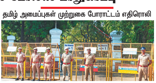
தமிழ் அமைப்புகள் முற்றுக்கை போராட்டம் எதிரொலி

சென்னை, மே 24- திருவள்ளூர் படத்திற்கு காவிய உடை அணிவித்து நிகழ்ச்சி நிறல் வெளியிட்ட கவர்னரின் செயலை கண்டித்து பல்வேறு தமிழ் அமைப்புகள் முற்றுக்கை போராட்டம் அறிவித்ததால், கிண்டியில் உள்ள கவர்னர் மாளிகைக்கு கூடுதல் போலீஸ் பாதுகாப்பு மேம்பட்டுள்ளது.