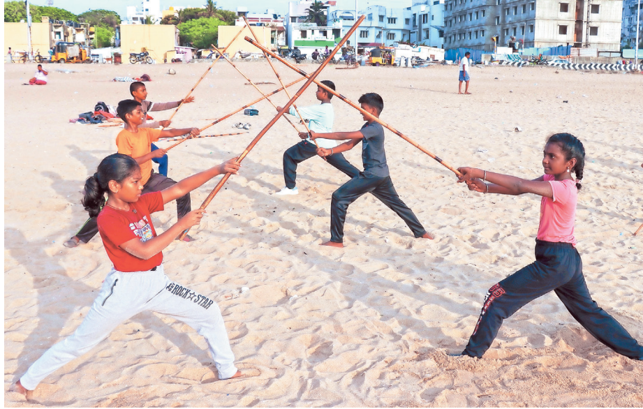
சென்னை பட்டினப்பாக்கம் கடற்கரை மணல் பரப்பில் ஆர்வமுடன் சிலம்ப பயிற்சியில் ஈடுபடும் சிறுவர்கள்.

சென்னை, மே 24- கேரள முதல்வர் பினராயி விஜயனுக்கு இனிய பிறந்தநாளை யொட்டி தமிழக முதல்வர் மு.க.ஸ்டாலின் வாழ்த்து தெரிவித்துள்ளார். இதுதொடர்பாக அவர் வெளியிட்ட சமூக