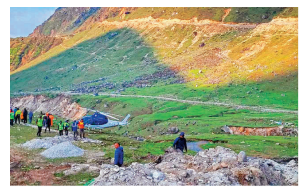
சரமாக தரையிறங்கியது. தொழில்நுட்பக் கோளாறு காரணமாக 7 பேருடன் ஹெலிகாப்டர் பத்திரமாக தரையிறக்கப்பட்டதாக கூறப்படுகிறது. இதுகுறித்து பேரிடர் மேலாண்மை அதிகாரி ருத் பிரயாக் கூறுகையில், 'சிரிசி ஹெலி

கேதார்நாத், மே 24- கேதார்நாதத்தில் ஹெலிகாப்டர் அவசரமாக தரையிறங்கிய சம்பவத்தில் விமானி மற்றும் 6 பயணிகள் உயிர்தப்பினர். கேதார்நாத் அடுத்த சிரிசி ஹெலிபேட்டில் இருந்து விமானி மற்றும் 6 பயணிகள் களுடன் இன்று காலை 7.05 மணிக் கு ஹெலிகாப்டர் புறப்பட்டது. இந்த ஹெலிகாப்டர் புறப்பட்ட சில நிமிடங்களில் சுமார் 100 மீட்டர் தொலைவில் அவ