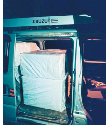
காரில் கடத்தப்பட்ட போதை மாத்திரை யாக வந்தது. போலீசார் தடுத்து நிறுத்தினர். போலீசாரைப் பார்த்ததும் காரில் இருந்த 2 பேர், வண்டியை நிறுத்திவிட்டு, கீழே இறங்கி கண்ணிமைக்கும் நேரத்தில் தப்பியோடினர். காரில் போலீசார் சோதனை செய்தபோது, அட்டைப் பெட்டிகளில் போதை மாத்திரை அடைவைகள் இருந்தன. காரின் கட்டுப்பாட்டு அமைப்பை பறிமுதல் செய்த போலீசார், மண்டபம் காவல்நிலையத்திற்கு கொண்டு வந்தனர். பறிமுதல் செய்த போதை மாத்திரைகளின் சர்வேசை மதிப்பு ரூ.1.5 கோடி என கூறப்படுகிறது. காரில் இருந்து தப்பியோடியவர்கள் யார்? போதை மாத்திரைகளை எங்கிருந்து கொண்டு வந்தனர் என்பது குறித்து போலீசார் தீவிரமாக விசாரித்து வருகின்றனர்.

மண்டபம், மே 24- மண்டபம் அருகே, வேதானைக் கடற்கரையில் இருந்து இலங்கைக்கு கடத்த முயன்ற ரூ.1.5 கோடி மதிப்பிலான போதை மாத்திரைகளை போலீசார் பறிமுதல் செய்தனர். தப்பியோடியவர்களை தேடி வருகின்றனர். ராமநாதபுரம் மாவட்டம், மண்டபம் அருகே உள்ள வேதானைக் கடலோரப் பகுதியில் இருந்து இலங்கைக்கு போதைப் பொருள் கடத்தப்பட்ட உள்ளதாக போதைப்பொருள் தடுப்பு நுண்ணறிவு பிரிவு போலீசாருக்கு ரகசிய தகவல் கிடைத்தது. இதைப் பற்றி போதைப்பொருள் தடுப்பு