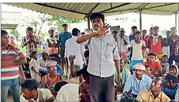
ডাইনি অপবাদের বিরুদ্ধে প্রতিবাদে সমিল শ্রীরামপুর গ্রামের বাসিন্দারা

এই সময়, দুবরাজপুর: তথাকথিত 'ডাইনি' নয়, বরং ডাইনি তরকারি দেওয়া জানগুরু বিরুদ্ধে রুখে দাঁড়ালো আদিবাসী গ্রাম। একটি দুর্ঘটনার জন্য সাত জন মহিলাকে 'ডাইনি' অপবাদ দিতেই, ডাইনি প্রথার মতো কুসংস্কারের বিরুদ্ধে এককাত্তা হয়ে প্রতিবাদ জানালো জোরালো কণ্ঠে। বীরভূমের দুবরাজপুর রকের সদাইপুর থানার মেটে গ্রামের ঘটনা।