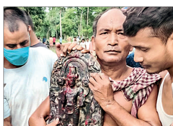
মুর্তি উদ্ধার দক্ষিণ দিনাজপুরের কুমারভি থানার চৌধুরা গ্রামে মঙ্গলবার পুঙ্কর খননের সময় উদ্ধার হয় প্রাচীন আমলের কালো পাথরের চারটি মুর্তি। সেগুলি স্থানীয় মন্দিরে রেখে পূজা শুরু করেন গ্রামবাসীরা। খবর পেয়ে ঘটনাস্থলে পৌঁছন কুমারভি থানার পুলিশ। মুর্তি উদ্ধার করতে গেলে গ্রামবাসীদের বিক্ষোভের মুখে পড়তে হয় পুলিশকে। গাড়ি ঘিরে শুরু হয় বিক্ষোভ। পরে একটি মুর্তি নিয়ে ফিরে যেতে হয় পুলিশকে। বাকি তিনটি বিষ্ণু ও লক্ষ্মীর মুর্তি স্থাপন করা হয় মন্দিরে।