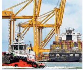
'The gradual opening up of major global markets and improvement of situation in the country are expected to push exports growth further'

Growth in labour-intensive sectors such as cereal preparations, gems and jewellery, engineering goods,