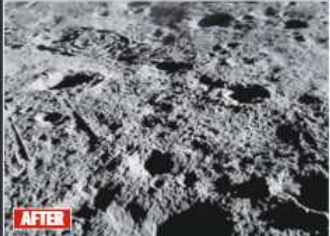
nar surface before and nder hop experiment PHOTOS: PTUSE