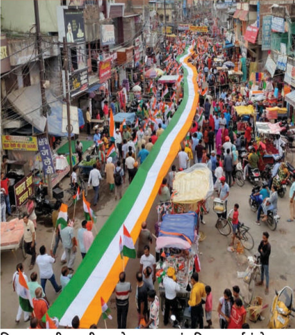
बिहार राज्यातील हाजीपुरमध्ये ७६ व्या स्वातंत्र्यदिनाच्या पूर्वसंध्येला लोक 'तिरंगा यात्रेत' सहभागी झाले. यावेळी नागरिकांनी घेतलेला लांब तिरंगा ध्वज आकर्षण ठरला होता.