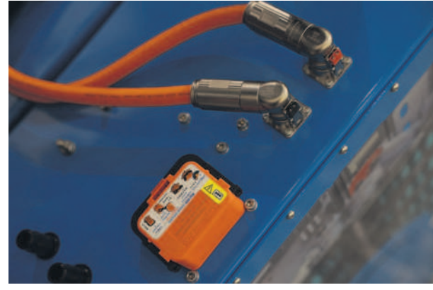
The scheme aims to incentivize production of 20GWh battery storage capacity.

Bangalore-based precious jewellery firm Rajesh Exports, which had qualified for incentives for a 5GWh lithium-ion cell production capacity is yet to submit plans and is likely to be disqualified. The three firms committed a