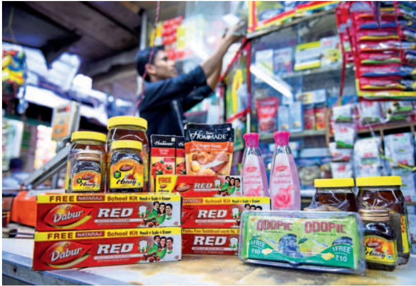
With markets opening up and consumers venturing out, demand for packaged foods has rebounded, prompting companies to increase their advertising spending.