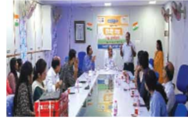
The Bank of India organised a Hindi promotion programme as part of the ongoing Hindi Month.

The Bank of India (BOI) Zonal Office has launched Hindi Month from August 15 to September 14. This was in an effort to promote Hindi and the staff and officials were motivated to make sustained efforts for the promotion of Hindi. For this the bank had organised several e-mail contests, Raj Bhasha Shabd Gyan Pratiyogta, Hindi debate contest, painting contest and several others. On Wednesday the Bank of