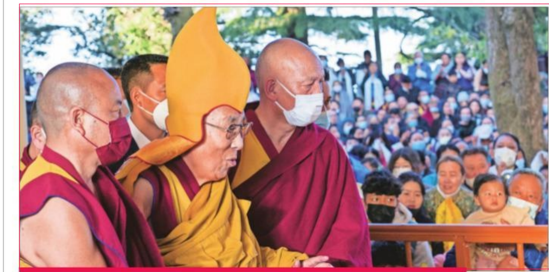
Tibetan spiritual leader Dalai Lama in a ceremonial yellow hat arrives at the Tsuglakhang temple to give a sermon in Dharamsala, on Tuesday. Dalai Lama apologised on Monday after a video which showed him asking a boy to suck his tongue triggered a backlash on social media.