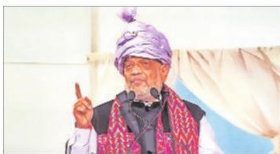
Union Home Minister Amit Shah at an event in Kibithoo, Arunachal Pradesh, Monday

Meanwhile, China criticised Shah's visit to Arunachal Pradesh, stating that it violated Chinese sovereignty over the area. Responding to a question, Chinese Foreign Ministry spokesman Wang Wenbin said in Beijing: "Zangnan (China's name for Arunachal Pradesh) is part of China's territory... The activity of the senior Indian official in Zangnan violates China's territorial sovereignty and is not