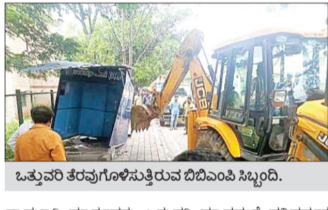
ಒತ್ತುವರಿ ತೆರವುಗೊಳಿಸುತ್ತಿರುವ ಬಿಬಿಎಂಪಿ ಸಿಬ್ಬಂದಿ.

ಪಾದಚಾರಿ ಮಾರ್ಗಗಳಲ್ಲಿ ಇಟ್ಟಿರುವ ಅನಧಿಕೃತ ಅಂಗಡಿ, ಅಂಗಡಿ ಮುಂಗಟ್ಟುಗಳು, ಅನುಪಯುಕ್ತ ತಳ್ಳುವ ಗಾಡಿಗಳು, ಹಗ್ಗಿನ ಬಾಕ್ಸ್‌ಗಳನ್ನು ತೆರವುಗೊಳಿಸಿ ಪಾದಚಾರಿಗಳ ಸುಗಮ ಸಂಚಾರಕ್ಕೆ ಯಾವುದೇ ರೀತಿಯ ಸಮಸ್ಯೆಯಾಗದಂತೆ ಅನುಮೋದಿಸಲಾಯಿತು. ಕಾರ್ಯಾಚರಣೆ ನಡೆಯುವ ಮುನ್ನ ವ್ಯಾಜಿಗಳ ಗಮನಕ್ಕೆ