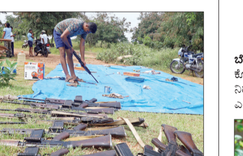
ನಶ್ವರ ಮೀನಲು ಪಡೆಯ ನಿಯಂತ್ರಣ ಕೋಠಿಗೆ ನೀರು ನುಗ್ಗಿ ಹಾನಿಯಾಗಿರುವ ಪಿಸ್ತೂಲುಗಳನ್ನು ಬಿಬಿಎಂಪಿ ಸಿಬ್ಬಂದಿ ತೆರವುಗೊಳಿಸುತ್ತಿರುವ ಸಿಬ್ಬಂದಿ.

ಬೆಂಗಳೂರು: ನಗರದಲ್ಲಿ ಕಳೆದ ಎರಡು ದಿನಗಳ ಹಿಂದೆ ಸುರಿದ ಧಾರಾಳದ ಮಳೆಗೆ ಅನೇಕ ಕಡೆ ಅವರ್ಷಾಡು ಸಂಭವಿಸಿದ್ದು, ಇದರ ನಡುವೆ ಉಲ್ಕಾಶ ಉಪನಗರದ ನಗರ ಪುಷ್ಪಮ ವಿಭಾಗದ ಸಶಶ್ರಮಿಣಿ ವಲಯ ನಿಯಂತ್ರಣ ಕೋಠಿಡಿ ನೀರು ನುಗ್ಗಿ ಪಿಸ್ತೂಲುಗಳ ಹಾನಿಯಾಗಿದ್ದು, ದಾಖಲೆಗಳು ನೀರುಪಾಲಾಗಿದೆ. ಏಕಾಏಕಿ ಮಳೆಯ ನೀರು ನುಗ್ಗಿದ ಪರಿಣಾಮ ನಿಯಂತ್ರಣ ಕೋಠಿಯಲ್ಲಿದ್ದ ಸುರಿಯು ಪಿಸ್ತೂಲು, ಫೋರಿಸ್ ಭದ್ರತಾ ಸಿಬ್ಬಂದಿಯ ದಾಖಲೆ ಪತ್ರಗಳು, ಇನ್ನಿತರ ಕಡತಗಳು ನೀರಿನಲ್ಲಿ ಮುಳುಗಿ ಹಾನಿಯಾಗಿವೆ. ಬೆಳಿಗ್ಗೆ ಎಂದಿನಂತೆ ಸಿಬ್ಬಂದಿ ಕೋಠಿಡಿ ಬಂದು ಪರಿಶೀಲನೆ ನಡೆಸಿದಾಗ ನೀರು ನುಗ್ಗಿರುವುದು ಗೊತ್ತಾಯಿತು. ಈ ಬಗ್ಗೆ ಮಾಹಿತಿ ಪಡೆದು ಸ್ವಲ್ಪ ದೊಡ್ಡದಾದ ಕೋಠಿಡಿ ಸಿಬ್ಬಂದಿ, ನೀರಿಗೆ ಹಾನಿಯಾಗಿದ್ದ ಪಿಸ್ತೂಲು, ಕಡತಗಳನ್ನು ರಕ್ಷಿಸಿ ಮಾಡಿ, ಪರಿಶೀಲನೆ ನಡೆಸಿದರು.