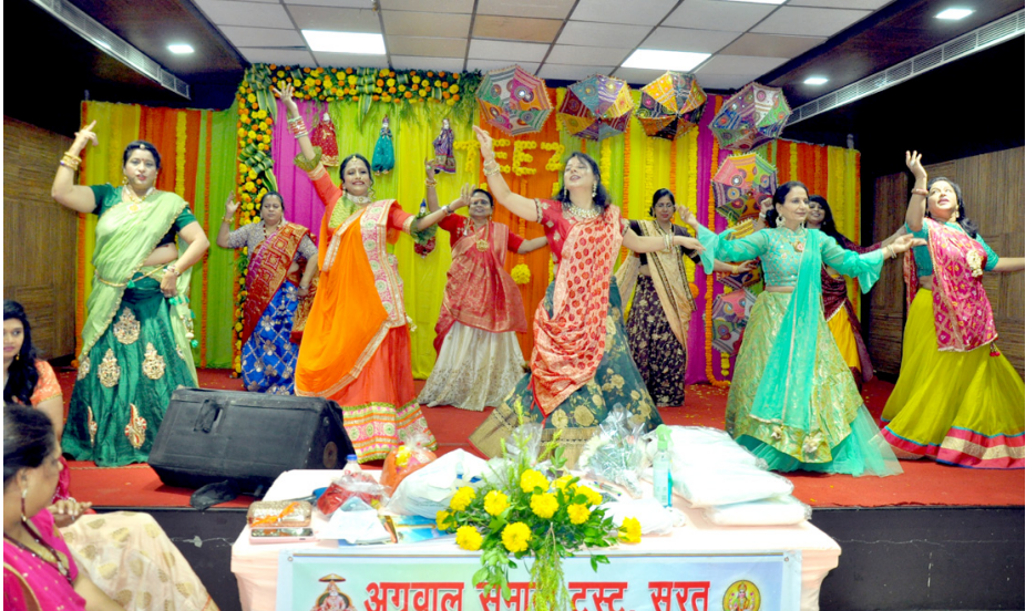
અગ્રવાલ સમાજ મહિલા મંડળ દ્વારા ઘોડદોડ રોડ સ્થિત અગ્રવાલ સમાજ ભવન ખાતે પરંપરાગત 'સાવળ સિંવારા' કાર્યક્રમનું આયોજન કરાયું હતું.