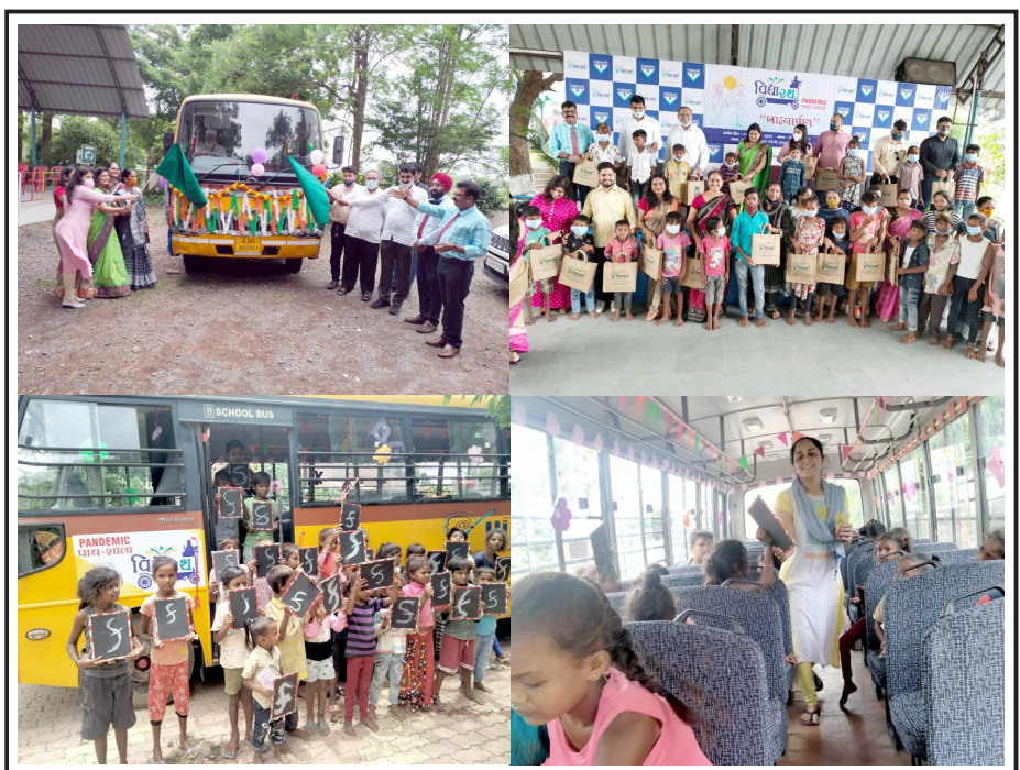
વાયબ્રન્ટ ગ્રુપ ઓફ સ્કૂલ્સ દ્વારા શિક્ષણનું નવતર અભિયાન