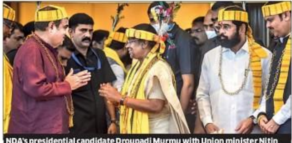
NDA's presidential candidate Droupadi Murmu with Union minister Nitin Gadkari, Maharashtra CM Eknath Shinde and BJP leaders in Mumbai

Mumbai: The Eknath Shinde government on Thursday took several steps to reverse the decisions taken by the Maha Vikas Aghadi government. From announcing a reduction in cess on petrol and diesel by Rs 5 and Rs 3 respectively to giving clearances for the Mumbai-Ahmedabad bullet train project, to reinstating pensions for those jailed during the emergency—several decisions were taken by the Shinde government.