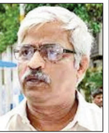
রাজ্য সরকারের নতুন পরিচালনা দুয়ারে পুলিশ নিয়ে শনিবার...