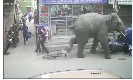
আরামবাগ শহরে হাতির তাণ্ডবের দৃশ্য।