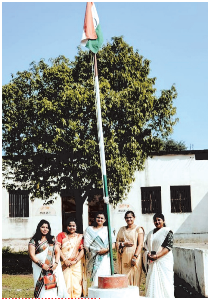
सिंहोरा ■ राज न्यूज नेटवर्क

कोरोना महामारी के बीच देश की आजादी का जश्न नगर के साथ सभी ग्रामीण क्षेत्रों में कोरोना प्रोटोकॉल के साथ उमंग और उत्साह के साथ मनाया गया। इस अवसर पर जगह-जगह ध्वजारोहण के साथ सोशल डिस्टेंसिंग का पालन करते हुए अनेक कार्यक्रम संपन्न हुए। कहीं भी सांस्कृतिक आयोजन इस बार भी नहीं हुए न ही बच्चों ने हिस्सा लिया।