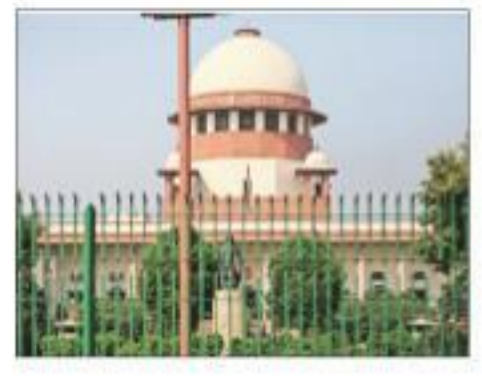
The court also asked how the technical committee will check what authorisations have been given by the government, and if it will be able to examine contracts and information on the procurement and use of the software, if at all it has been bought by the government.

THE SUPREME COURT on Monday asked the Centre if it wanted to bring on record whether Pegasus spyware was used or not, to intercept phone of journalists, politicians, activists and court staff.