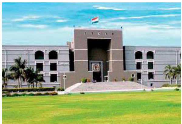
દરમિયાન રાજ્ય સરકારે ગુજરાત હાઈકોર્ટમાં રજૂઆત કરી હતી કે, સરકાર કેન્દ્રીય વિભાગો તરફથી જાહેર થયેલી માર્ગદર્શિકાને અનુસરશે. વાસ્તવિક રીતે સ્કૂલો શરૂ ન થાય ત્યાં સુધી કોઈ પણ સ્કૂલ ફી લઈ શકશે નહીં. પ્રાર્થમિકમાં બાળકો માટે રીસેસ સાથેના બે સેશન રાખવા તાકીદ કરી છે. ત્યાર બાદ રાજ્ય સરકારે ખાનગી સ્કૂલોના વિદ્યાર્થીઓને ઓનલાઈન શિક્ષણ આપવાનો નિર્ણય કર્યો હતો. સરકારના આ નિર્ણય બાદ ખાનગી સ્કૂલોએ વિદ્યાર્થીઓનો અભ્યાસ ન બગડે તે માટે સોમવારથી ઓનલાઈન શિક્ષણ ફરી શરૂ કરી દેવાની જાહેરાત કરી હતી. ત્યાર બાદ ૨૭ જુલાઈથી ફરી ઓનલાઈન એજ્યુકેશન આપવાની શરૂઆત કરવામાં આવી હતી.

અમદાવાદ, તા. ૩૦ મહામારી કોરોનાને કારણે હાલ રાજ્યની તમામ સ્કૂલો બંધ હોવાથી વિદ્યાર્થીઓને ઓનલાઈન શિક્ષણ આપવામાં આવી રહ્યું છે. પરંતુ છેલ્લા થોડા સમયથી આ અંગે વિવાદ શરૂ થયો છે. ઓનલાઈન શિક્ષણ અંગે આજે ગુજરાત હાઈકોર્ટે સુનાવણી કરતા કહ્યું કે, ઓનલાઈન શિક્ષણનો નિર્ણય યોગ્ય છે. વાલીઓને ફી ભરવામાં તકલીફ હોય તો રાજ્ય સરકાર કેમ મદદ નથી કરતી? સરકાર આ મામલે યોગ્ય માળખું ઉભું કરે તો આવા પ્રશ્નો ના ઉપસ્થિત થાય. જ્યારે અરજદારે કહ્યું કે, સરકારનું વહણ શંકાસ્પદ છે. કોર્ટે ફી મુદ્દે સરકારના વલણને પ્રથમ દર્શનીય રીતે ગેરવ્યાજબી ગણાવ્યું છે. આવાલીકલ કોર્ટે આ મામલે અંતિમ નિર્ણય લઈ શકે છે. છેલ્લા એક મહિના કરતા વધુ સમયથી રાજ્યના શાળા સંચાલકોએ ઓનલાઈન શિક્ષણના નામે વાલીઓ પાસે ફી લેવાનું શરૂ કર્યું હતું. આ મામલે અનેક વાલીઓએ સરકારમાં રજૂઆતો કરી હતી પરંતુ સરકાર પણ ચૂપ બેઠી હતી. જ્યારે