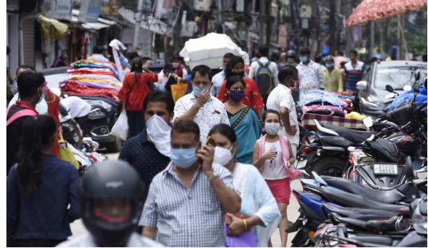
છુટછાટ વધારાઈ છે. ગૃહ મંત્રાલય દ્વારા જાહેર કરવામાં આવેલા દિશા-નિર્દેશોમાં ૫ ઓગસ્ટથી જીમ

ગાંધીનગર, તા. ૩૦ મુખ્યમંત્રી વિજયભાઈ રૂપાણીના અધ્યક્ષ સ્થાને અને નાયબ મુખ્યમંત્રી નીતિન ભાઈ પટેલની ઉપસ્થિતિમાં મળેલી ઉચ્ચ સ્તરીય બેઠકમાં અનલોક-૩ સંદર્ભમાં ભારત સરકારે જાહેર કરેલી ગાઈડ લાઈન્સના અનુસંધાને ગુજરાત માટે કેટલાક મહત્વપૂર્ણ નિર્ણયો લેવામાં આવ્યા છે. આ બેઠક માં લેવાયેલા નિર્ણયો અનુસાર મુખ્યમંત્રીએ રાજ્યમાં ૧ ઓગસ્ટ થી રાત્રી ૬ કક્યુમાંથી સંપૂર્ણપણે મુક્તિ આપવાની જાહેરાત કરી છે. રાજ્યમાં દુકાનો ૮ વાગ્યા સુધી તેમજ હોટલ રેસ્ટોરન્ટ રાત્રે ૧૦ વાગ્યા સુધી ચાલુ રાખી શકાશે. કેન્દ્ર સરકાર ની માર્ગદર્શિકા અને એસઓપી મુજબ રાજ્યમાં જીમ અને યોગ સેન્ટર પંચમી ઓગસ્ટ થી ખોલી શકાશે. આ સિવાયની અન્ય બાબતો માટે કેન્દ્ર સરકારની પ્રવર્તમાન ગાઈડ લાઈન્સને રાજ્ય સરકાર અનુસરશે એમ પણ બેઠકમાં નિર્ધારિત કરવામાં આવ્યું હતું. અને જણાવવાનું કે જે કાલે એટલે બુધવારે કેન્દ્ર સરકાર દ્વારા અનલોક-૩ની માર્ગદર્શિકા જાહેર કરવામાં આવી. જે મુજબ અનેક છુટછાટ વધારાઈ છે. ગૃહ મંત્રાલય દ્વારા જાહેર કરવામાં આવેલા દિશા-નિર્દેશોમાં ૫ ઓગસ્ટથી જીમ