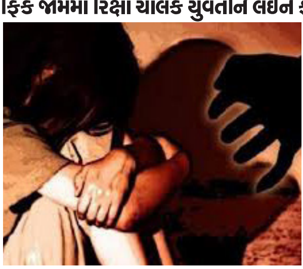
વર્ષથી અચાનક માનસિક રોગનો હુમલો થતો હોઈ તે અસામાન્ય વર્તન કરે છે. તેની ગોત્રી જનરલ હોસ્પિટલમાં સારવાર ચાલતી હોઈ ગઈ કાલે સવારે તે પિતા સાથે હોસ્પિટલમાં ગઈ હતી. ઘરે પરત જતી વખતે તેને માનસિક રોગનો હુમલો થતાં તે દવા લેવા લાઈનમાં ઉભા રહેલા પિતાને છોડીને દવાખાનામાંથી નીકળીને રેલવે સ્ટેશન પહોંચી

વડોદરા, તા. ૩૦ ગોત્રી હોસ્પિટલમાં માનસિક રોગની સારવાર કરાવીને ઘરે જવા માટે નીકળેલી યુવતી અચાનક માનસિક આવેગમાં આવતા સ્ટેશન પહોંચી હતી. પરિવારજનો તેને સ્ટેશનથી શોધી કાઢતા યુવતીએ રિક્ષામાં એકલી જ બેસવાની જીદ કરતા પરિવારજનોએ રિક્ષાચાલકને દિવાળીપુરા અતિથિગૃહ પાસે પહોંચવાનું કહી તેઓ અન્ય વાહન પર રિક્ષાની પાછળ રવાના થયા હતા. જોકે રિક્ષાચાલક યુવક ચકલી સર્કલ પાસે ટ્રાફિક જામનો લાભ લઈ યુવતીનું અપહરણ કરી હાલોલ પાસે ધાબાડુંગી ખાતે લઈ ગયો હતો અને તેની પર બળાત્કાર ગુજારીને તેને આજે સવારે કારેલી બાગમાં છોડી ગયો હતો. વર્ષથી અચાનક માનસિક રોગનો હુમલો થતો હોઈ તે અસામાન્ય વર્તન કરે છે. તેની ગોત્રી જનરલ હોસ્પિટલમાં સારવાર ચાલતી હોઈ ગઈ કાલે સવારે તે પિતા સાથે હોસ્પિટલમાં ગઈ હતી. ઘરે પરત જતી વખતે તેને માનસિક રોગનો હુમલો થતાં તે દવા લેવા લાઈનમાં ઉભા રહેલા પિતાને છોડીને દવાખાનામાંથી નીકળીને રેલવે સ્ટેશન પહોંચી