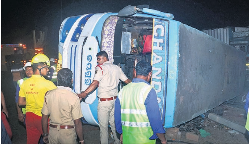
କଟକ ଗୋପାଳପୁର ନିକଟରେ ଓଲଟି ପଡିଥିବା ବସ୍ତୁ ଲୋକଙ୍କୁ ଉଦ୍ଧାର କରାଯାଇଛି । ଆହତଙ୍କୁ ଆୟୁର୍ଲାଙ୍ଗୁରେ ଡାକ୍ତରଖାନା ନେବାବେଳେ ଘ୍ନାନାୟ ଲୋକେ ଗହଳି ଏଡାଇବାକୁ କର୍ତ୍ତବ୍ୟ କରିଛନ୍ତି ।

ସେଲ୍ଫି ପଠାଇବା ସମୟରେ ନିଜର ନାମ ଏବଂ ମୋବାଇଲ ନମ୍ବର ଦେବାକୁ ଭୁଲନ୍ତୁ ନାହିଁ। ଯୋଗ୍ୟ ବିବେଚିତ ଫଟୋ ପ୍ରକାଶ ପାଇବ।