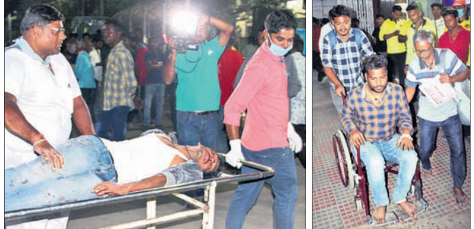
ଆହତ ଯାତ୍ରୀଙ୍କୁ ଏସ୍ପିବି ମେଡିକାଲକୁ ନିଆଯାଇଛି।

ପ୍ରଥମେ ଯାତ୍ରୀଙ୍କୁ ଉଦ୍ଧାରକଲେ ସ୍ଥାନୀୟ ଲୋକେ