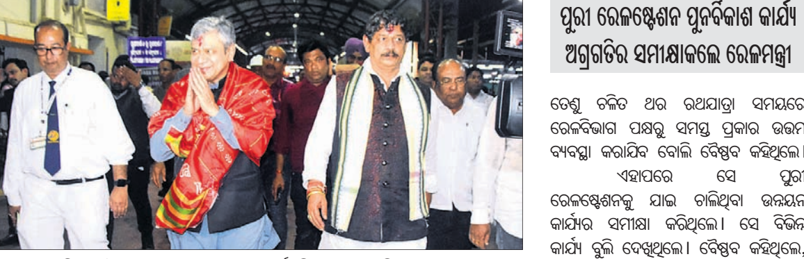
ରେଳମନ୍ତ୍ରୀ ଅଶ୍ୱିନୀ ବୈଷ୍ଣବ ପୁରୀ ରେଳ ଷ୍ଟେଶନରେ କାର୍ଯ୍ୟ ନିରୀକ୍ଷଣ କରୁଛନ୍ତି ।