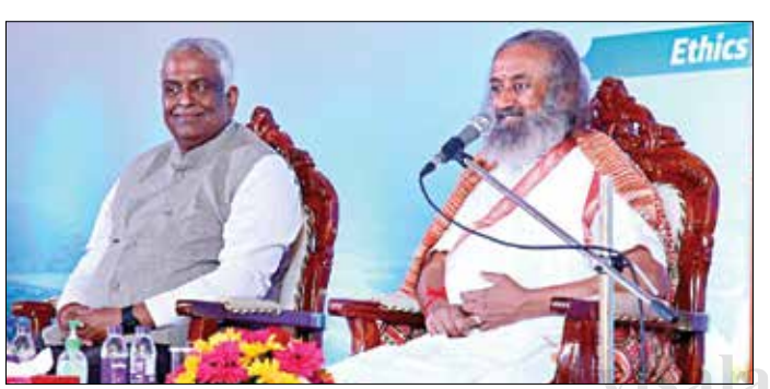
வருமானவரித் துறை அலுவலகம் சார்பில், மனித மூலதன மேம்பாட்டு திட்டத்தின் கீழ் 'அரசு ஊழியர்களுக்கான நிர்வாகத்தில் நெறிமுறைகள் மற்றும் மதிப்புகள்' என்ற தலைப்பில் சிறப்பு நிகழ்ச்சி நடைபெற்றது. இதில், 'வாழும் கலை' அமைப்பின் நிறுவனர் ஸ்ரீஸ்ரீரவிசங்கர் சிறப்பு விருந்தினராக கலந்துகொண்டார். அவர் பேசியபோது:

சென்னை உயர்ந்த நெறிமுறைகள், ஒழுக்கத்தை வரமான வரித் துறை அதிகாரிகள் நிலைநாட்ட வேண்டும் என்று 'வாழும் கலை' அமைப்பின் நிறுவனர் ஸ்ரீஸ்ரீரவிசங்கர் வலியுறுத்தினார்.