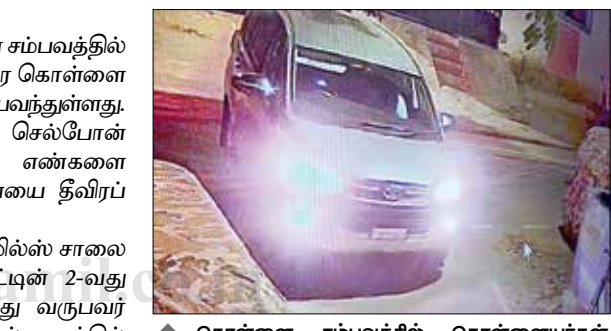
கொள்ளை சம்பவத்தில் கொள்ளையர்கள் பயன்படுத்திய போலி பதிவெண் கொண்ட கா.ர்.

நகைக்கடைக்கு செல்வதும் கண்காணிப்பு கோரவில் பதிவாசி இருந்தது. மேலும், சத்தம் வராத நவீன காஸ் வெல்டர் கருவியைப் பயன்படுத்தி கடைபின் ஷட்டரை ஒருவர் துளையிடுவதும், அந்த துளையின் வழியாக சிலர் உள்ளே சென்று நகைகளை கொள்வாயடித்துக் கொண்டு வெளியே வருவதும், பின்னர் அந்த காரில் ஏறி தப்பிச் செல்வதும் கண்காணிப்பு கோரவில் பதிவாசி இருந்தது. அவர்கள் வந்த காரின் பதிவெண்ணை போலீஸார் ஆய்வு செய்தபோது, அது போலியான பதிவெண் கொண்ட கா.ர் என்பதும் விசாரணையில் தெரியவந்தது.