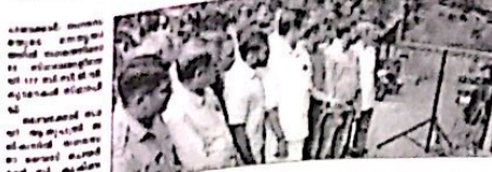
നഗരം ഇനി ക്യാമറകണ്ണിൽ.

പാലക്കാട് നഗരം ഇനി ക്യാമറകണ്ണിൽ. പാലക്കാട് നഗരം ഇനി ക്യാമറകണ്ണിൽ.