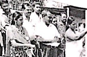
പാലക്കാട് യൂണിറ്റി ഡേ ആഘോഷം ഇന്ന്.

പാലക്കാട് യൂണിറ്റി ഡേ ആഘോഷം ഇന്ന്. പാലക്കാട് യൂണിറ്റി ഡേ ആഘോഷം ഇന്ന്.