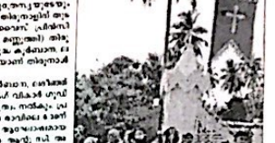
ആലത്തൂർ ലിറ്റിൽ ഫ്ലൂവർ പള്ളി തിരുനാൾ തുടങ്ങി.

ആലത്തൂർ ലിറ്റിൽ ഫ്ലൂവർ പള്ളി തിരുനാൾ തുടങ്ങി. ആലത്തൂർ ലിറ്റിൽ ഫ്ലൂവർ പള്ളി തിരുനാൾ തുടങ്ങി.