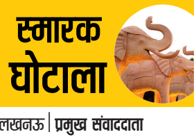
लखनऊ | प्रमुख संवाददाता