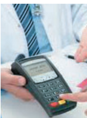
While empanelling hospitals for cashless facilities, insurers will also have to focus on the delivery of quality health care services

either "NABH Entry Level Certification" (or higher certificate) issued by National Accreditation Board for Hospitals and Healthcare Providers (NABH) or State Level Certificate (or higher certificate) under National Quality Assurance Standards (NOAS), issued by National Health Systems Resources Centre (NHSRC).