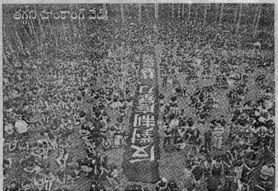
పాఠశాల ప్రభుత్వానికి ప్రజలకు మద్దతు కౌసలీగారును సంఘర్షణ రోజురోజుకూ తీవ్రమవుతోంది. 20 మంది అందోళన కారులను అధికారులు అరెస్టులు చేసిన నేపథ్యంలో మరింతగా రెచ్చిపోయిన ప్రజలు రెండోరోజు అధికారం కూడా పెద్ద సంఖ్యలో రోడ్లపై బైరాయింపారు. ఏకంగా రెండు ర్యాలీలను నిర్వహించి చైనా పాలకులకు మరియు తీవ్ర స్థాయిలో సవాలు విసిరారు.

గ్రూప్లో న్యాయస్థానాల నిర్ణయాలను గుర్తు సాగడం హర్షించదగ్గ పరిణా ముఖ్యమైన అంశమని ఆయన పిలు వు వ్యవస్థపై ప్రజలకున్న విశ్వాసాన్ని సూ కోల్పోయే విధంగా జడ్జిలు లేదా బి వ్యవహారించకూడదని ఆయన ఇదిలా ఉండగా, అస్సాంలో పెండిం గుల సత్వర పరిష్కారానికి గౌహతి న్యాయమూర్తి చొరవ తీసుకోవాలని