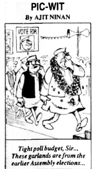
Tight poll budget, Sir... These garlands are from the earlier Assembly elections...