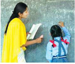
सच प्रतिनिधि | भोपाल

दो लाख 93 हजार 432 पद भरे और 69 हजार 667 पद रिक्त