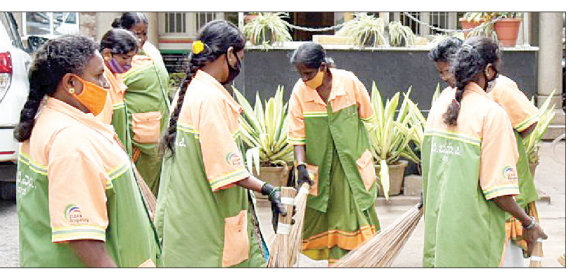
ಕಾಯಂ ಮಾಡುವ ಕಡತ ಮುಖ್ಯಮಂತ್ರಿಗಳ ಮುಂದಿತ್ತು. ಎರಡು ದಿನಗಳಲ್ಲಿ ಅನುಮೋದನೆ ಸಿಗಲಿವೆ. ಮುಂದಿನ ಎರಡು ವಾರಗಳ ವರದಿಯಲ್ಲಿ ಈ ಕುರಿತು ಅಧಿಸೂಚನೆ ಹೊರಡಿಸಲಾಗುವುದು. ಎಲ್ಲಾ 16 ಸಾವಿರ ಪೌರ ಕಾರ್ಮಿಕರನ್ನು ಏಕಕಾಲದಲ್ಲಿ ಕಾಯಂಗೊಳಿಸಲಾಗುವುದು. ಆದುದರಿಗೆ 3,673 ಕಾರ್ಮಿಕರಿಗೆ ಸಂಬಂಧಿಸಿದಂತೆ ಪ್ರಸ್ತುತ ನಡೆಯುತ್ತಿರುವ ಸೇವಾಕಾರಿ ಪ್ರಕ್ರಿಯೆ ಸ್ಥಗಿತಗೊಳಿಸಲಾಗುವುದು ಎಂದೂ ಭರವಸೆ ನೀಡಿದರು.

ಬೆಂಗಳೂರು: ಬಿಬಿಎಂಪಿ ವ್ಯಾಪ್ತಿಯಲ್ಲಿ ಕಾರ್ಯನಿರ್ವಹಿಸುತ್ತಿರುವ ಎಲ್ಲಾ ಪೌರ ಕಾರ್ಮಿಕರ ಸೇವೆಯನ್ನು ಕಾಯಂಗೊಳಿಸುವ ಕುರಿತು ಸರ್ಕಾರ ಭರವಸೆ ನೀಡಿರುವ ಹಿನ್ನೆಲೆಯಲ್ಲಿ ಸೇವೆ ಕಾಯಂ ಆಗಿರಲು ಪೌರ ಕಾರ್ಮಿಕರು ಮಂಗಳವಾರದಿಂದ ಆರಂಭಿಸಿದ ಅನಿರೀಕ್ಷಾಪೂರ್ವಕ ಬುಧವಾರ ಅಂತಿಮಗೊಳಿಸಿದ್ದಾರೆ.