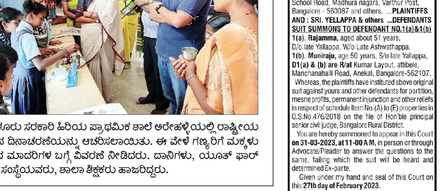
ಬೆಂಗಳೂರು ಸರ್ಕಾರಿ ಹಿರಿಯ ಪ್ರಾಥಮಿಕ ಶಾಲೆ ಅರೇಜಿಯಲ್ಲಿ ರಾಷ್ಟ್ರೀಯ ವಿಜ್ಞಾನ ದಿನಾಚರಣೆಯನ್ನು ಆಚರಿಸಲಾಯಿತು. ಈ ವೇಳೆ ಗಣ್ಯರಿಗೆ ಮಕ್ಕಳು ವಿಜ್ಞಾನ ಮಾಹಿತಿ ಬಗ್ಗೆ ವಿವರಣೆ ನೀಡಿದರು. ದಾನಿಗಲ, ಯೂತ್ ಫೌಂಡೇಷನ್ ಸಂಸ್ಥೆಯವರು, ಶಾಲಾ ಶಿಕ್ಷಕರು ಹಾಜರಿರಿದ್ದರು.