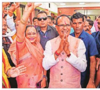
BJP candidate from Vidisha Shivraj Singh Chouhan with his wife greets people after his victory, on Tuesday