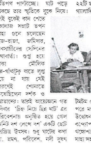
চিহ্ন নিয়ে ছিন্ন ঘাটের ছোট চলচ্চিত্র উৎসব পাড়ায়।