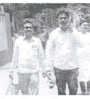
মনোনিয়ন জমা দিতে আরামবাগ মহুকুমা শাসকের কার্যালয়ে তৃণমূল প্রার্থীদের হিড়িক।