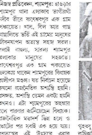
দুই জায়ের লড়াইয়ে জমজমাট বাণেশ্বরপুর।