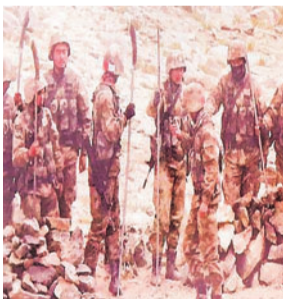
पूर्वी लद्दाख में छह महीने से दोनों देशों के बीच है गतिरोध

भारत और चीन पूर्वी लद्दाख में छह महीने से चल रहे गतिरोध को सुलझाने के करीब पहुंच रहे हैं। दोनों पक्षों के बीच समझौते के तहत गतिरोध वाले सभी स्थानों से सैनिकों और हथियारों को पीछे हटाने पर व्यापक सहमति बनने की संभावना है। आधिकारिक सूत्रों ने बुधवार को बताया कि प्रस्ताव के व्यापक प्रारूप के तहत समझौता होने पर एक दिन में सशस्त्र कर्मियों को हटाने, पूर्वी लद्दाख में पैंगोंग झील के उत्तरी और दक्षिणी किनारे के ख़ास क्षेत्रों से सैनिकों को वापसी और दोनों पक्षों द्वारा प्रक्रिया का सत्यापन शामिल है।