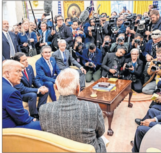
Prime Minister Narendra Modi with US President Donald Trump, at the White House in Washington, DC on Thursday

The reporter, whose identity has not yet been confirmed, can then be heard saying: "Thank you, Mr President.