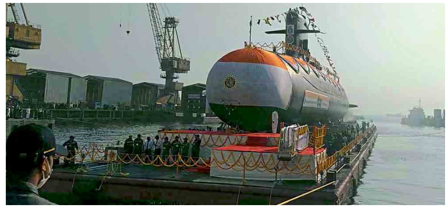
मुंबई: वागीर पाणबुडीचे गुरुवारी माझगाव गोदीत जलवरण करण्यात आले.