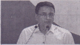
कोरोना महामारी में आज दुनिया की राजधानी बन गया है भारत : सुरजेवाला

को यहां संवाददाता सम्मेलन में कहा कि 24 मार्च को मोदी ने कहा था, 'महामारी का युद्ध 18 दिन चला था। कोरोना से युद्ध जीतने में हमें 21 दिन लगेंगे,' लेकिन अब 166 दिन बाद भी हमें 'कोरोना महामारी को महामारी' छिड़ी है। लोग मर रहे हैं लेकिन मोदी कोई कदम नहीं उठा रहे हैं। उन्होंने कहा कि कोरोना महामारी में भारत आज दुनिया की राजधानी बन गया है। हालात यह बन गये हैं कि देश में हर दिन दुनिया में सबसे ज्यादा कोरोना संक्रमण के मामले मिल रहे हैं।