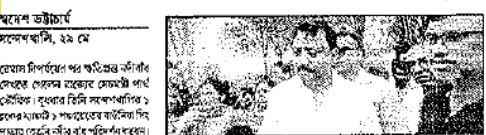
সন্দেশখালিতে নদীবাঁধ পরিদর্শনে সেচমন্ত্রী