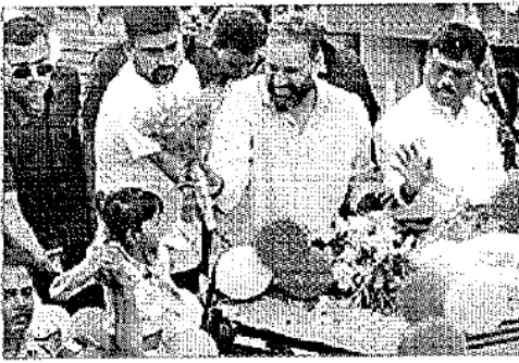
রাজভবনের ৪ জন হেয়ার স্ট্রিট থানায়... রাজভবনের ৪ জন হেয়ার স্ট্রিট থানায়...