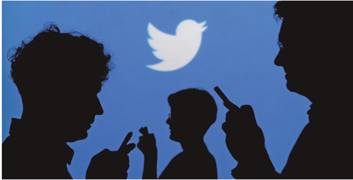
While the social media platform plans to test some features soon, others are in the concept stage.