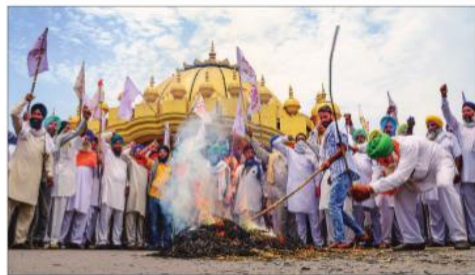
Farmers stage a protest to mark seven months of their agitation against new farm laws, in Amritsar, on Saturday

Thousands of farmers, mainly from Punjab, Haryana