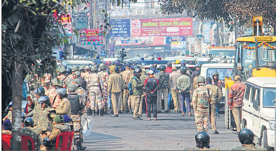
हल्द्वानी के वनभूलपुरा में गुरुवार को हुई हिंसा के बाद शुक्रवार को दिनभर कर्फ्यू लगा रहा। भारी संख्या में फोर्स तैनात रही।

हल्द्वानी/देहरादून, हिन्दुस्तान टीम। मुख्य सचिव राधा रतूड़ी ने शुक्रवार को हल्द्वानी के हिंसा प्रभावित क्षेत्र में वनभूलपुरा थाने का निरीक्षण किया। उन्होंने थाने में किए गए नुकसान की जानकारी ली। साथ ही हिंसा में घायल हुए पुलिस कर्मियों से बातचीत की। उन्होंने कहा कि क्षेत्र की शांति व्यवस्था को प्रभावित करने वाले उपद्रवियों के खिलाफ सख्त कार्रवाई की जाएगी। समीक्षा के बाद ही कर्फ्यू हटाने पर विचार: मुख्य सचिव ने कहा कि हल्द्वानी में अब स्थिति नियंत्रण में है। वनभूलपुरा की समीक्षा के बाद ही वहां कर्फ्यू हटाने पर विचार किया जाएगा। उन्होंने कहा कि घटना की जांच के लिए अतिरिक्त पुलिस बल का भेजा जा रहा है। उपद्रवियों की पहचान कर ली गई है। निरीक्षण के बाद शासन स्तर पर रिपोर्ट प्रस्तुत की जाएगी। जिसके बाद दोषियों के खिलाफ कठोर कार्रवाई की जाएगी।