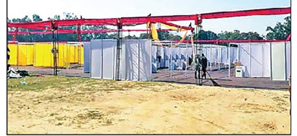
ਪੁਦਰਸ਼ਨੀ 'ਚ ਲਗਾਏ ਗਏ ਦੋ ਝੁਲਿਆਂ ਦੀ ਤਸਵੀਰ।(ਸੱਜੇ) ਪੁਦਰਸ਼ਨੀ ਦੀਆਂ ਚੱਲ ਰਹੀਆਂ ਤਿਆਰੀਆਂ ਦੀ ਤਸਵੀਰ।