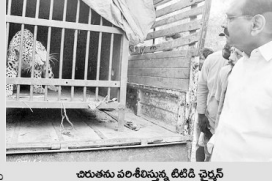
చిరుతను పరిశీలించే డి.వై.సి

ప్రజాశక్తి - తిరుమల ద్వారా తిరుమల మొదటి హాల్ లోని చిరుతను మరలించాలని ప్రజాశక్తి డిమాండ్ చేసింది. తిరుమల మొదటి హాల్ లోని చిరుతను మరలించాలని ప్రజాశక్తి డిమాండ్ చేసింది.