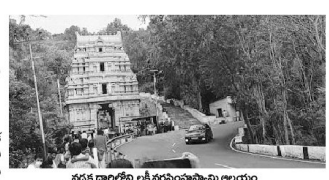
నడక దారిలోని లక్ష్యానుసాన్ని అలయం

అనుమతి పొందాకే తిరుమల నడక దారిలో ఇనుప కంచె నిర్మాణం ప్రారంభమవుతుంది. అందులో ఇనుప కంచె నిర్మాణం ప్రారంభమవుతుంది. అందులో ఇనుప కంచె నిర్మాణం ప్రారంభమవుతుంది. అందులో ఇనుప కంచె నిర్మాణం ప్రారంభమవుతుంది.