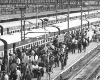
The station will be developed to ensure multimodal transport integration and development

"New Delhi Railway Station Redevelopment is a flagship project of the Rail Land Development Authority, and the first to be undertaken on the Transit-Oriented Development concept in Delhi-NCR. It will incur the capital expenditure