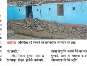
जोशीमठ: जमीनदोस्त तळे घेण्याचे घर जमीनदोस्त करण्यात येत आहे.

हल्ली मा. गा. जखरेच्या जमीनीच्या आधारे घरात तळे घेणे. कोणत्याही प्रकारचा अर्थसंबंध नसतानाही घरातून नागरिकांची संख्या वाढत जाईल.