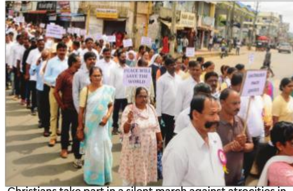
Christians take part in a silent march against atrocities in Chikmagalur, Manipur on Friday

While Thowai Kuki village falls under the jurisdiction of Ukhrul police, it comes under the revenue district of Kamjong, where Tangkhul Nagas are in majority too. While the village is not located right at the border with the neighbouring Meitei-dominated Imphal East district, it is not very far from it. Yainganpokpi in Imphal East -- the area around which has seen considerable unrest and firing -- is 10