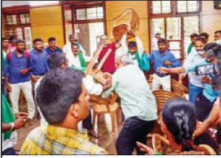
ભારતીય કિસાન યુનિયનના પ્રવક્તા અને ખેડૂત નેતા ટિકેતની કોર્ટમાં પાટનગર બેંગલુરુમાં યોજાયેલા પરિષદ દરમિયાન થયેલો પક્કામુઠ્ઠી બાદ એક શબ્દે રોકેશ ટિકેત પર શાહી ફેંકતા ટિકેતના સમર્થકો આરોપીને પકડીને મારમારી રહ્યા છે.

બેંગલુરુ, તા. ૩૦ - પછી રોકેશ ટિકેતના સમર્થકોએ કહ્યું કે ટિકેતના સમર્થકોએ કહ્યું કે, આ વીડિયોમાં કે ચંદ્રશેખરે ભક્ત સ્પ્રાઈફના બદલે પેસાની માંગ કરી હતી. આટલું જ નહીં તેમણે રોકેશ ટિકેત અને અન્ય કિસાન નેતાઓનો પણ ઉલ્લેખ કર્યો હતો. જ્યારે બેંગલુરુમાં મીડિયા સાથે વાતચીત દરમિયાન રોકેશ ટિકેતને ચંદ્રશેખરે વિશે સવાલ પૂછવામાં આવ્યો તેમણે કહ્યું કે, તેમને ચંદ્રશેખર સાથે કોઈ લેવા દેવા નથી. રોકેશ ટિકેતે કહ્યું કે, ચંદ્રશેખર ફોડ છે. ત્યારબાદ આનંદ જ ચંદ્રશેખરના સમર્થકોમાંથી એક એ રોકેશ ટિકેત પર શાહી ફેંકી હતી. તેનાથી રોકેશ ટિકેતના કાર્યકર્મમાં હાજર સમર્થકો ભડકી ગયા હતા. તેમણે શાહી ફેંકનાર વ્યક્તિને પકડી લીધો હતો. આ પછી ચંદ્રશેખરના સમર્થકો અને રોકેશ ટિકેતના સમર્થકો વચ્ચે ઘર્ષણ યથું ચલ્યું. બંને પક્ષોમાં ખૂબ જ મારપીટ થઈ હતી. ત્યારબાદ કાર્યકર્મમાં ખૂબ જ ઝડપથી અને સુચોરણે પણ ચલાવાયા હતા. બીજા તરફ રોકેશ ટિકેતે કોર્ટમાં પોલીસ પરસવાલ ઉઠાવ્યા હતા.