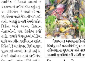
વેશાખ વદ અમાસના દિવસે વટસાવિત્રી નિમિત્તે પરિશિત મહિલાઓ તેના પતિના સારા સ્વાસ્થ્ય અને દિવાળી માટે વટસાવિત્રીનું જાત રાખે છે. આખો દિવસ ઉપવાસ કરીને વડના વૃક્ષની પૂજા કરે છે. તસ્વીરમાં હરિયાણા ગુરુગ્રામ ખાતે વટસાવિત્રી નિમિત્તે એક વ્રતધારક મહિલા વડના વૃક્ષના ઘડની કરતે નાણાછરી લગાવી પૂજાવિત્રી કરી રહેલી નજરે પડે છે.

બેંગલુરુ, તા. ૩૦ - પછી રોકેશ ટિકેતના સમર્થકોએ કહ્યું કે ટિકેતના સમર્થકોએ કહ્યું કે, આ વીડિયોમાં કે ચંદ્રશેખરે ભક્ત સ્પ્રાઈફના બદલે પેસાની માંગ કરી હતી. આટલું જ નહીં તેમણે રોકેશ ટિકેત અને અન્ય કિસાન નેતાઓનો પણ ઉલ્લેખ કર્યો હતો. જ્યારે બેંગલુરુમાં મીડિયા સાથે વાતચીત દરમિયાન રોકેશ ટિકેતને ચંદ્રશેખરે વિશે સવાલ પૂછવામાં આવ્યો તેમણે કહ્યું કે, તેમને ચંદ્રશેખર સાથે કોઈ લેવા દેવા નથી. રોકેશ ટિકેતે કહ્યું કે, ચંદ્રશેખર ફોડ છે. ત્યારબાદ આનંદ જ ચંદ્રશેખરના સમર્થકોમાંથી એક એ રોકેશ ટિકેત પર શાહી ફેંકી હતી. તેનાથી રોકેશ ટિકેતના કાર્યકર્મમાં હાજર સમર્થકો ભડકી ગયા હતા. તેમણે શાહી ફેંકનાર વ્યક્તિને પકડી લીધો હતો. આ પછી ચંદ્રશેખરના સમર્થકો અને રોકેશ ટિકેતના સમર્થકો વચ્ચે ઘર્ષણ યથું ચલ્યું. બંને પક્ષોમાં ખૂબ જ મારપીટ થઈ હતી. ત્યારબાદ કાર્યકર્મમાં ખૂબ જ ઝડપથી અને સુચોરણે પણ ચલાવાયા હતા. બીજા તરફ રોકેશ ટિકેતે કોર્ટમાં પોલીસ પરસવાલ ઉઠાવ્યા હતા.