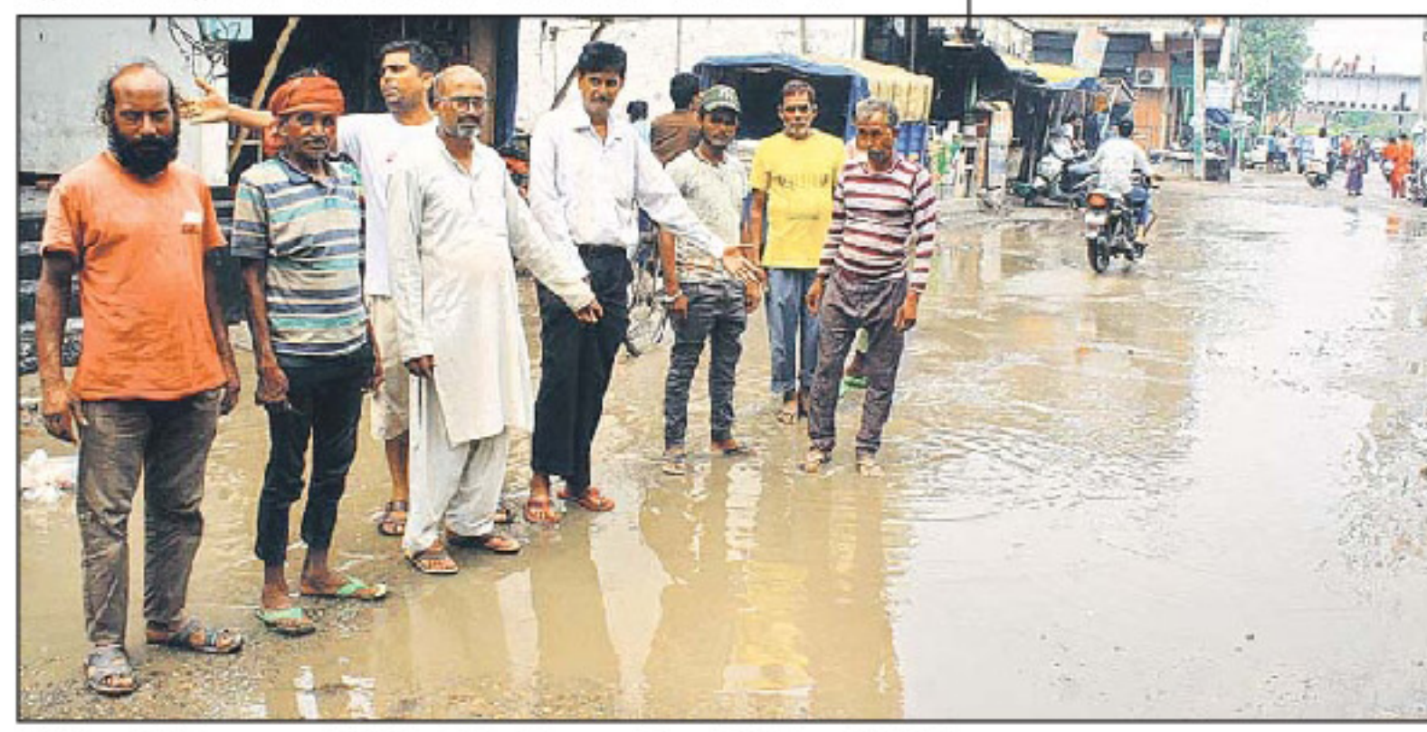
ਨਿਊ ਹਰਗੋਬਿੰਦ ਨਗਰ, ਮੱਲ੍ਹੀ ਰੋਡ 'ਤੇ ਖੜ੍ਹੇ ਬਰਸਾਤੀ ਪਾਣੀ ਨੂੰ ਦਿਖਾਉਂਦੇ ਹੋਏ ਦੁਕਾਨਦਾਰ।

ਪੰਚਾਇਤ ਧਾਂਦਰਾ, ਸਮੂਹ ਨਗਰ ਨਿਵਾਸੀਂ ਕਿੱਟੂ ਵਿਸ਼ੇਸ਼ ਤੌਰ 'ਤੇ ਪਹੁੰਚ ਕੇ ਰੰਗਾਰੰਗ ਕਰਦਿਆਂ ਦੋਸ਼ੀ ਨੂੰ 10 ਸਾਲ ਕੈਦ ਅਤੇ ਇਕ ਲੱਖ ਅਤੇ ਐਨ.ਆਰ.ਆਈ. ਭਰਾਵਾਂ ਦੇ ਪ੍ਰੋਗਰਾਮ ਪੇਸ਼ ਕਰਨਗੇ, ਜੋ ਸਾਰਾ ਦਿਨ ਸਹਿਯੋਗ ਨਾਲ 'ਤੀਆਂ ਧਾਂਦਰੇ ਦੀਆ' ਦੇ ਨਿਰਵਿਘਨ ਚੱਲਣਗੇ।