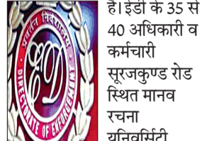
फरीदाबाद के सबसे बड़े शिक्षण संस्थान मानव रचना में ईडी की टीम ने छापेमारी चल रही है।

फरीदाबाद। फरीदाबाद के सबसे बड़े शिक्षण संस्थान मानव रचना में ईडी की टीम ने छापेमारी चल रही है। ईडी के 35 से 40 अधिकारी व कर्मचारी सूरजकुण्ड रोड स्थित मानव रचना यूनिवर्सिटी, एनआईटी पांच मानव रचना शिक्षण संस्थान के कॉंप्यूट कार्यालय मानव रचना स्कूल व संस्थान के संचालकों के घर पहुंचे। टीम के साथ सीआरपीएफ के जवानों की टुकड़ी थी।