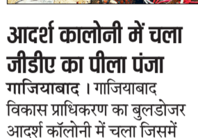
आदर्श कालोनी में चला जीडीए का पीला पंजा गाजियाबाद।