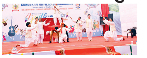
गुरुग्राम विश्वविद्यालय से संबद्ध 22 कालेजों के प्रतिभागियों ने लिया हिस्सा।