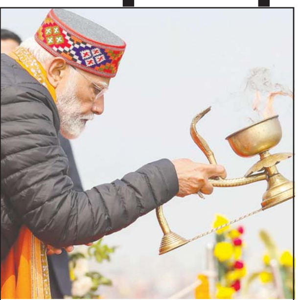
PRAYAGRAJ, PM Narendra Modi offering Ganga Aarti after takes a holy dip at Sangam, Maha Kumbh Mela 2025, in Prayagraj, Uttar Pradesh on Wednesday.

(IANS) The Bharatiya Janata Party (BJP) is likely to take a decisive lead over the ruling Aam Aadmi Party (AAP) and mark a strong comeback in the national capital, ending 27 years of its drought, preyears of its drought, pre-dicted Exit polls on Wednesday. A couple of pollsters showed the vot-ers gravitating towards the BJP in the high-oc-tane battle for Delhi and also projected it to emerge as the single largest party. The majority mark in the 70-member Delhi Assembly is 36.The AAP is expected to come a close second while the Congress is seen to remain on the margins, despite speculations of its strong show in Delhi polls.According to Cha-nakya Strategies, the BJP is projected to fetch any-