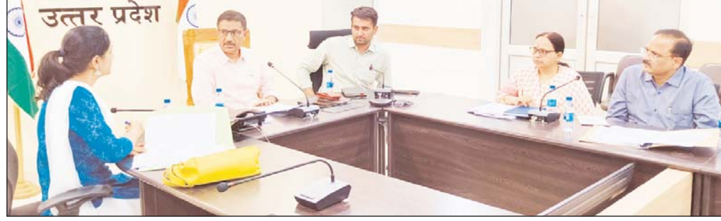
जिला वृक्षरोपण समिति की बैठक में बोले जिलाधिकारी व मौजूद अन्य अधिकारी।